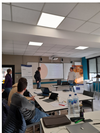
atelier de la réussite au CFA de Sorigny

En janvier et février, la Maison de l'Europe EUROPE DIRECT est intervenu auprès de nombreux jeunes soit en milieu scolaire, soit aux côtés d'associations afin de les informer sur les possibilités de mobilité et d'entrepreneuriat en Europe.