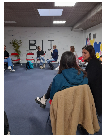
Rencontres des volontaires en service civique accompagnés par la Ligue de l'enseignement