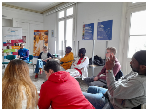
Information auprès de la Mission Locale de Tours