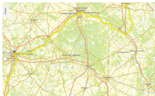
Véloroute 3 : de Ste Maure de Touraine à Montargis