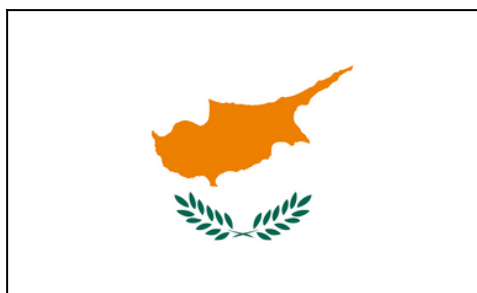
Drapeau de la République de Chypre

Depuis 1974, Chypre est divisée en deux. La partie Sud du territoire qui couvre deux tiers de l'île est la République de Chypre, reconnue par l'ONU et quasiment tous les pays du monde, dont la majorité des habitants sont des Chypriotes grecs. Le tiers Nord de l'île appelée République turque de Chypre du Nord, reconnue uniquement par la Turquie, compte une majorité d'habitants Chypriotes turcs.