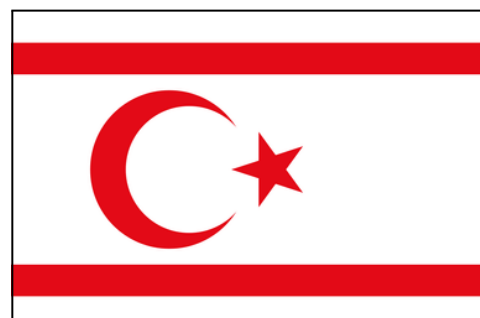
Drapeau de la République turque de Chypre du Nord

Avant que l'indépendance ne soit actée en 1960 des tensions sont observées entre communautés grecques, turques et les forces britanniques. Les grecs se battent contre les britanniques pour l'indépendance et contre les turcs par peur que ces derniers se rapprochent de la Turquie.