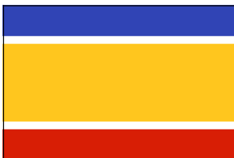
Drapeau proposé de la République-Unie de Chypre

Après l'indépendance, les tensions entre grecs et turcs s'intensifient et la séparation géographique émerge avec des déplacés et des affrontements mortels. Une guerre civile éclate en 1964 et nécessitera l'intervention des casques bleus pour protéger les populations civiles. Après une période d'instabilité politique à Chypre, la dictature grecque lance un coup d'Etat à l'été 1974 contre le président nouvellement élu. Après ce coup d'Etat l'armée turque intervient sur l'île et un conflit éclate.