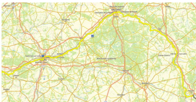
Véloroute 6 : de Chinon à Nevers

Eurovélo est le réseau européen qui permet de relier différents pays par des voies cyclables aménagées et pourvues de relais et haltes pour les voyageurs. La région Centre Val de Loire est traversée par 2 véloroutes : l'itinéraire 6 "Atlantique - Mer Noire" et l'itinéraire 3 "Véloroute des pèlerins". La véloroute 6 suit la Loire en traversant Tours, Blois et Orléans avant de bifurquer vers l'est à Nevers. La Via Turonensis de la véloroute 3 traverse Sainte-Maure-de-Touraine, Tours, Blois et Orléans, avant de bifurquer vers le nord à Briard et relier Paris via Montargis. La Loire à vélo a bénéficié de financements européens FEDER (fonds européen de développement régional) pour l'aménagement des voies cyclables.