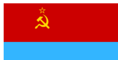
Drapeau de la République de la République socialiste soviétique d'Ukraine

La période bolchevique et stalinienne est, le plus souvent, dramatique pour l'Ukraine, à la fois promue comme république, mais pillée et affamée volontairement par Staline : l'Holodomor fait en quelques mois 3,5 à 4 millions de victimes. Pendant la Seconde Guerre Mondiale, l'Ukraine reste d'abord dans l'URSS dans le cadre du pacte germano-soviétique puis est envahie par l'Allemagne en 1941. Pendant toute la période soviétique jusqu'en 1991, l'Ukraine est la république modèle de l'URSS.