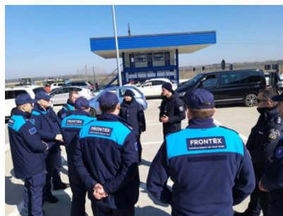
Agents de Frontex déployés en Moldavie

L'agence européenne pour la gestion de la coopération opérationnelle aux frontières extérieures des États membres de l'Union européenne, surnommée Frontex (forme abrégée de « Frontières extérieures »), est la seule manifestation concrète d'une coopération entre États membres au niveau défensif depuis 2004. L'agence, remplacée en 2018 par l'Agence européenne de garde-frontières et de garde-côtes surveille les frontières extérieures de l'UE. Le 1er juin prochain, les Danois seront invités à se prononcer par référendum sur l'entrée ou non de leur pays dans la politique de sécurité et de défense commune de l'UE.